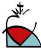
Sagrado Corazón CORAZONISTAS