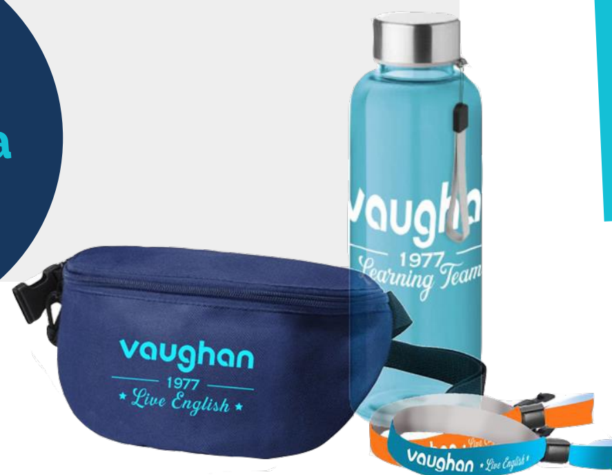
Pack de bienvenida Vaughan

Y además entra en el Sorteo de camiseta firmada por un jugador del Atlético de Madrid