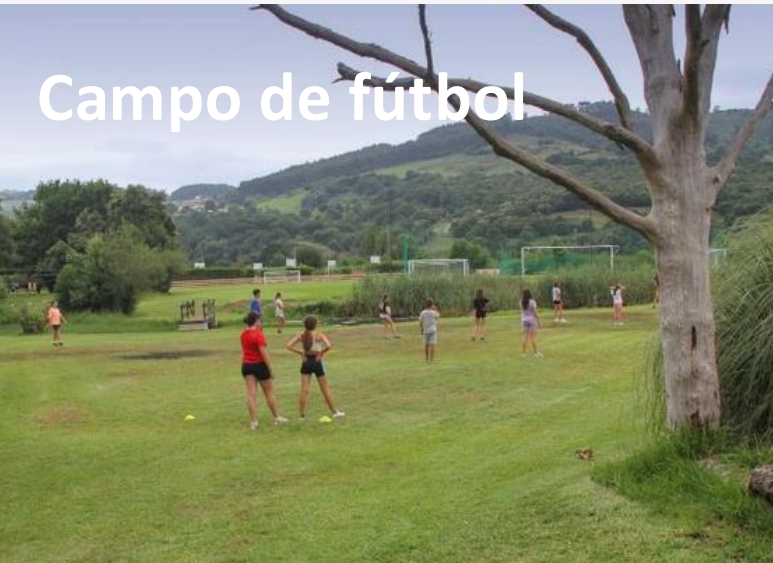
Campo de fútbol